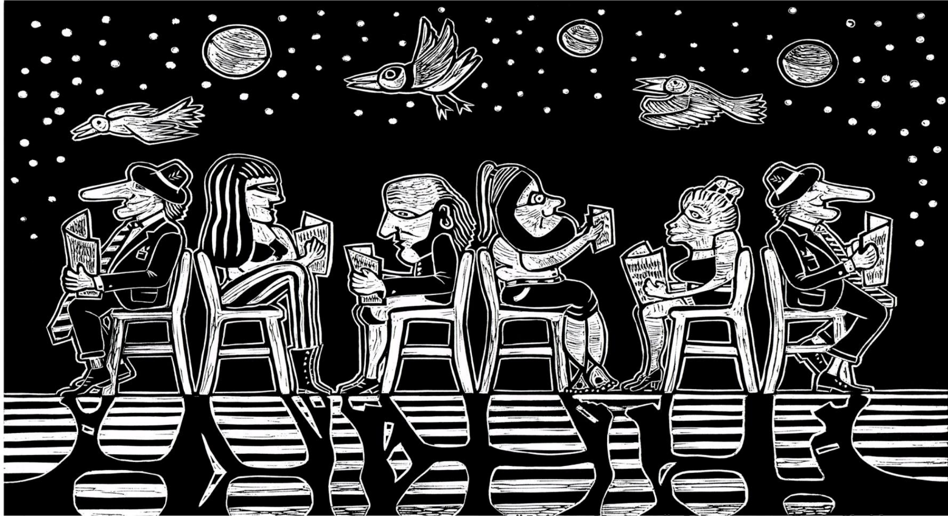
"Leituras Noturnas" - Linogravura - Paulo Cheida, 2013.