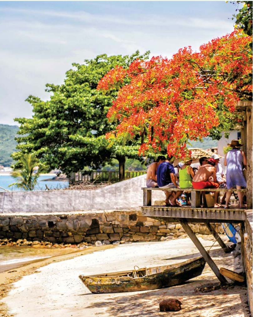
Olho-de-Boi (ojo de res en español) es una playa reservada para el nudismo.

La embajada de Brasil busca promocionar las joyas que se esconden en los alrededores de Río de Janeiro, la oferta de extiende desde el turismo colonial a playas paradisíacas.