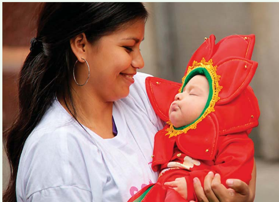
La leche materna salva vidas de cientos de bebés prematuros en nuestro país.