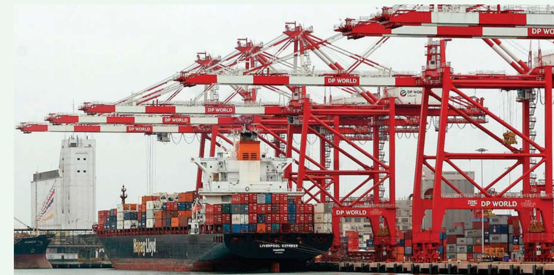
Comercio entre Brasil y Perú aumentó más de cinco veces en los últimos diez años.

ro, visitó el Perú a finales de julio y se reunió con su homóloga Magali Silva para negociar el acuerdo económico entre ambos países y transformarlo en un verdadero Tratado de Libre Comercio. Es decir, dentro de las negociaciones con el MINCETUR estamos analizando la incorporación de capítulos de servicios, compras gubernamentales,