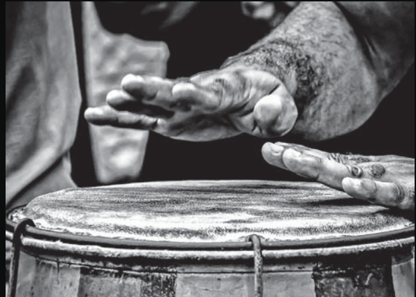
Fotografías registran momentos íntimos, ritos y costumbres del candomblé en Salvador de bahia.

“Los retratos de Rita Freire intenta resaltar las raíces afro-descendientes arraigadas en Salvador de Bahía”.