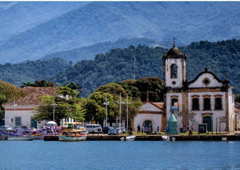
Histórica ciudad: la arquitectura colonial de Paraty es su principal atractivo turístico.

“Búzios es tan amigable a los extranjeros que muchos de ellos deciden quedarse”.