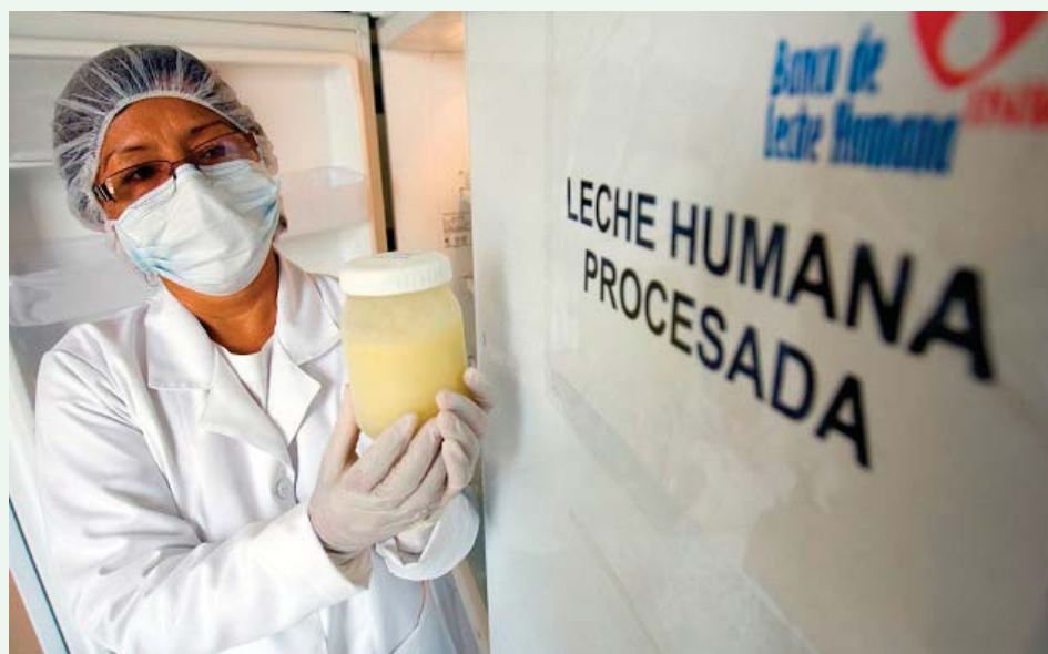
Donantes reciben exámenes para asegurar que la leche que donan sea saludable.

Los Bancos de Leche Humana, la política pública de diseño brasileño que más contribuye a la reducción de la mortalidad infantil en el mundo según la ONU y la OMS, hoy son una realidad en el Perú.