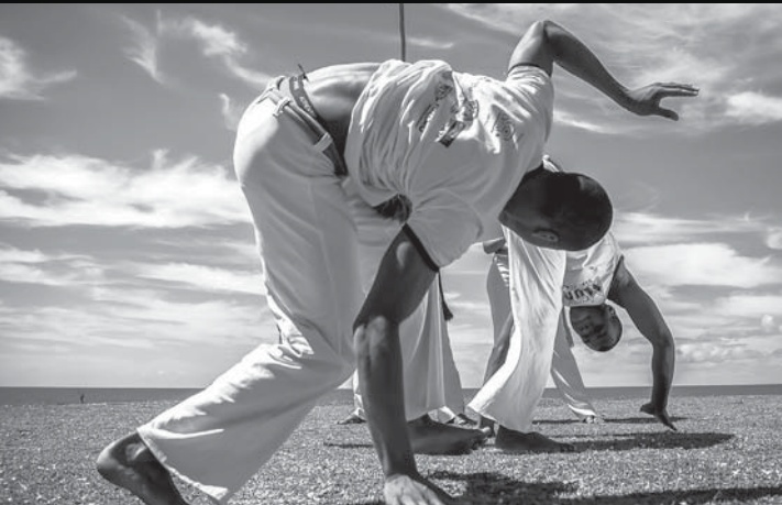
La capoeira, un legado de ritmo africano que se ha modernizado y es practicado en todo Brasil.

“Existió... El Dorado Negro existió” recuerda con un sentimiento próximo a la melancolía la letra de Quilombo , una canción de Gilberto Gil que en el Brasil es casi un himno. Para los peruanos esa palabra, cuyo origen se encuentra en la lengua africana kimbundú, puede tener otro sentido. Pero para la historia brasileña representa la rebeldía de los esclavos negros que en el siglo XVII buscaron formar una utopía lejos de sus opresores y terratenientes. Alrededor de 15 mil negros cimarrones –cómo se les conocía a aquellos que huían de la esclavitud– se lograron reunir en un solo punto para tramar desde el exilio el camino a la libertad.